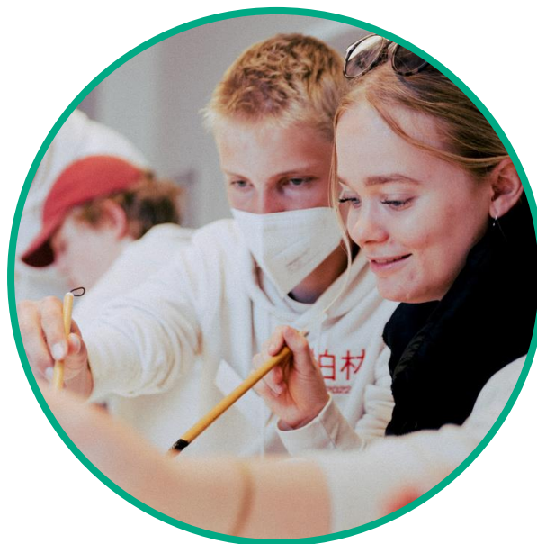
Mehrere Projekte an einer Schule